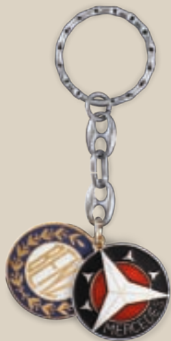
Porte-clés HISTORIQUE Porte-clés avec deux médaillons représen- tant l'étoile Mercedes- Benz des années 1909 et 1916. Matière : lai- ton chromé. Diamètre : env. 2,7 cm. B6 604 1442