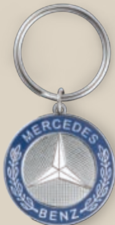
Porte-clés ETOILE HISTORIQUE Porte-clés représentant la version historique de l'étoile Mercedes-Benz de 1926. Matière : laiton chromé. Diamètre : env. 3,5 cm. B6 604 1441